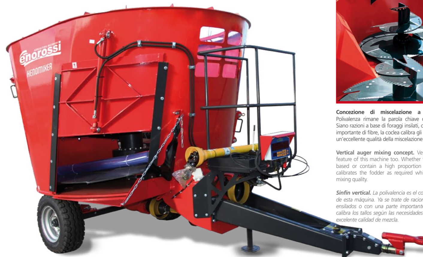
• Modello HENOMIXER ST 5 m³ / HENOMIXER ST 5 m³ model / Modelo HENOMIXER ST 5 m³

Los mezcladores HENOMIXER encuentran su colocación ideal en las fincas medianas y grandes y garantizan un procesamiento rápido y perfecto de los diferentes productos destinados a la preparación de la ración alimentaria. Fardos de forraje o ensilaje de hierba se cortan muy fácilmente gracias al equipo de corta-mezcla, que consta de sinfines verticales equipados con cuchillas en tungsteno especiales que aseguran un óptimo corte y una mezcla rápida. La ración es perfectamente mezclada, apetitosa y respeta las características organolépticas del producto. Se ofrece una distribución con diferentes soluciones de descarga, al fin de tener un pequeño tamaño de la máquina, factor básico en las maniobras alrededor de la granja donde hay pasajes estrechos y especiales necesidades.