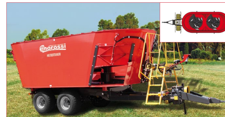
Modello HENOMIXER DXDC / HENOMIXER DXDC series / Modelo HENOMIXER DXDC