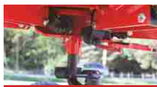
Кулачок в виде полусферы из литого чугуна со стальными роликами