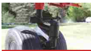
Сдвоенные поворачивающиеся колеса 15,600-6