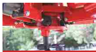
Система перевода из граблей во вспушиватель